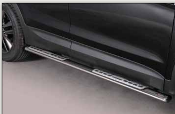
TUBES MARCHE PIEDS OVALE INOX DESIGN SANTA FE 2012+ REF : DSP333