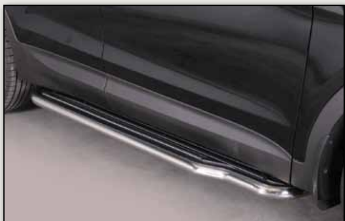
MARCHE-PIEDS INOX Ø 50 SANTA FE 2012+ REF : P333IX

NB : Accessoires également disponibles en noir - nous consulter.