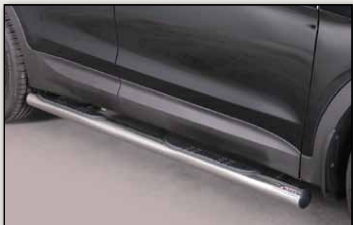
TUBES MARCHE PIEDS INOX Ø 76 SANTA FE 2012+ 5P REF : GP333IX