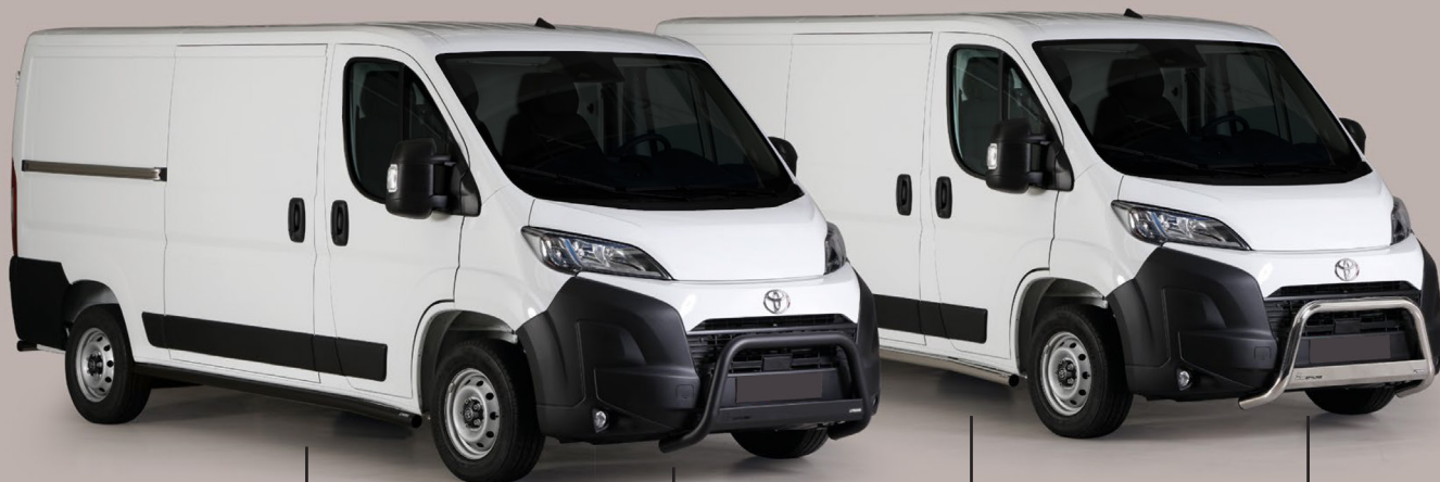
TUBE BAS DE CAISSE THERMOLAQUÉ NOIR